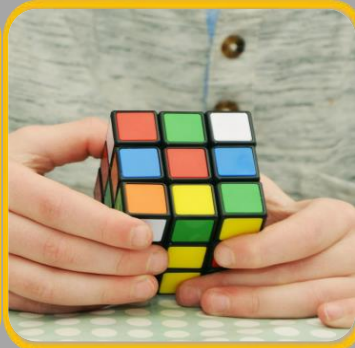
התפתחות האדם לאורך מעגל החיים

* למידה מוטורית * גישה רב צוותית * במחלות אקסטר-פרמידליות * הערכה, התערבות ושיקום באמצעות טכנולוגיה מתקדמת * טכנולוגיה למתקדמים * טיפול מרחוק * במקצועות הבריאות * מציאות מדומה