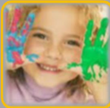
תפקוד מערכות החישה

* אשכול רב תחומי (רב"ע, פיזיותרפיה הפרעות בתקשורת): * משחק ומשחקיות * לחשוב סביבה לראות הזדמנות בראי ההתפתחות * אשכול התפתחותי רב"ע: * אוטיזם * הפרעות קשב וריכוז * איתור ומניעה של בעיות התפתחותיות בגיל הרך * עבודה שיתופית עם משפחות * הפרעות אכילה