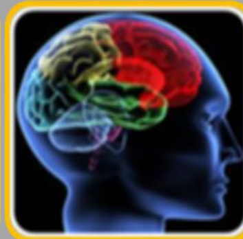
מוח, קוגניציה ועיסוק

* תפקוד ואי תפקוד של מערכות החישה * עיבוד חושי לאורך מעגל החיים * הפרעות בעיבוד חושי: התערבות * יישומים קליניים – מהערכה להתערבות